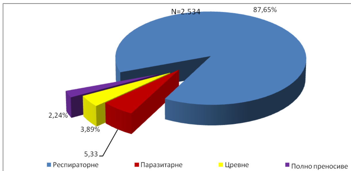
Графикон бр. 1. Процентуална заступљеност појединих група болести у укупном оболевању од заразних болести у Београду у јуну 2015. године

Заступљеност појединих група заразних болести у структури оболевања од свих заразних болести у Београду регистрованих током јуна приказана је на графикану бр.1.